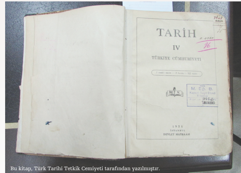
Bu kitap, Türk Tarihi Tetkik Cemiyeti tarafından yazılmıştır.

Cemiyetten hastalık bakımı, giyecek, mektep malzemesi vesaire gibi hususlarda yardım gören çocukların sayısı yıldan yıla arttı. Cemiyet teşkilatından bu gibi yardımlar gören çocukların sayısı 1930’a kadar her yıl ortalama 100.000 kadar oldu.